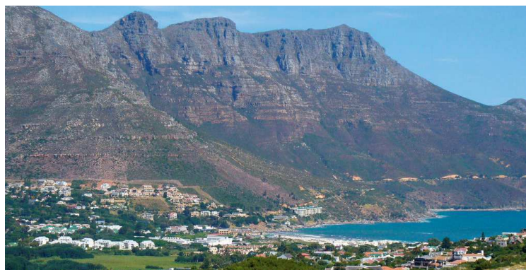
Hout Bay bei Kapstadt

Die Preise beruhen auf dem Veranstaltertarif der Fluggesellschaft mit limitierter Kapazität. Gegen Aufpreis weitere Sitzplatzkapazitäten in höheren Buchungsklassen, ohne Auswirkung auf die Sitzplatzqualität. Wir empfehlen eine frühzeitige Buchung!