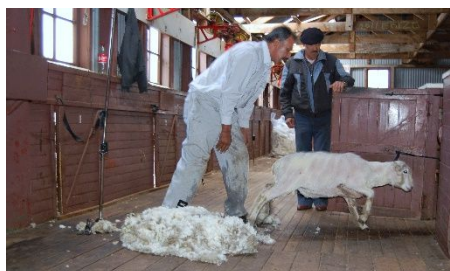
Schafschur - Patagonien

Chile - ein faszinierendes Land gesegnet mit den unterschiedlichsten geographischen Regionen und einzigartiger Flora und Fauna. Erleben Sie zunächst Santiago de Chile, das wirtschaftliche und kulturelle Zentrum Chiles mit über 6 Millionen Einwohnern, mit seinen zahlreichen Universitäten, Hochschulen, Museen und Bau- denkmälern. In der „Mitte“ – der chilenischen Schweiz bei Puerto Montt – die riesigen Seen von