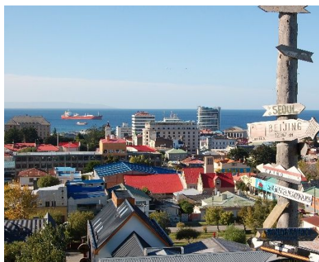
In Punta Arenas