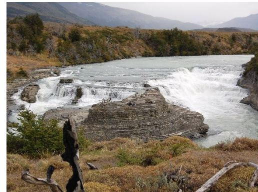
Saltos de Petrohué