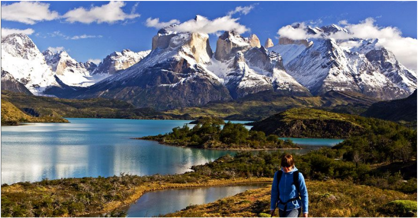
Cuernos del Paine