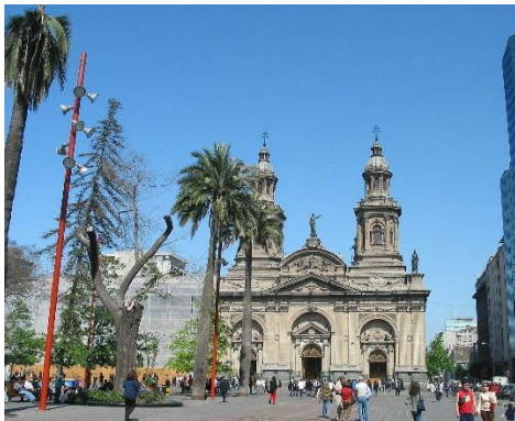
Santiago de Chile