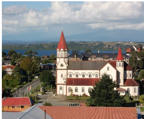
Kirche, Puerto Varas