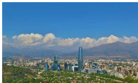
Santiago de Chile

Chile und Argentinien werden in Deutschland als die besondere Adresse für Naturliebhaber gehandelt. Die Entfernung z.B. zwischen Nordchile und Patagonien entspricht der zwischen Spanien und Norwegen - mit den entsprechenden Klima- und Landschaftsunterschieden! Die hier vorgestellte Programmvariante entführt Sie u.a. in die großartigen Metropolen beider Länder, nach Santiago de Chile und Buenos Aires. Als Kontrapunkt hierzu die begeisternden Naturlandschaften: Sehen Sie in der „chilenischen Schweiz“ bei Puerto Montt die riesigen Seen von