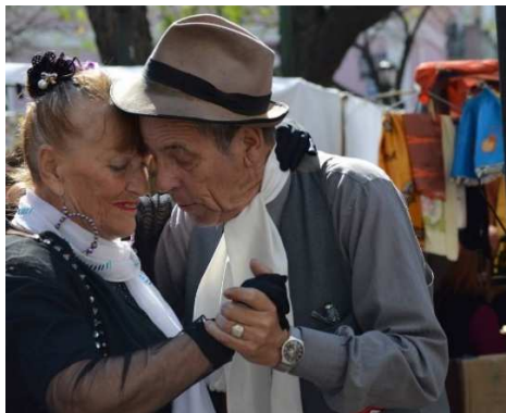
Altes Paar, Tango