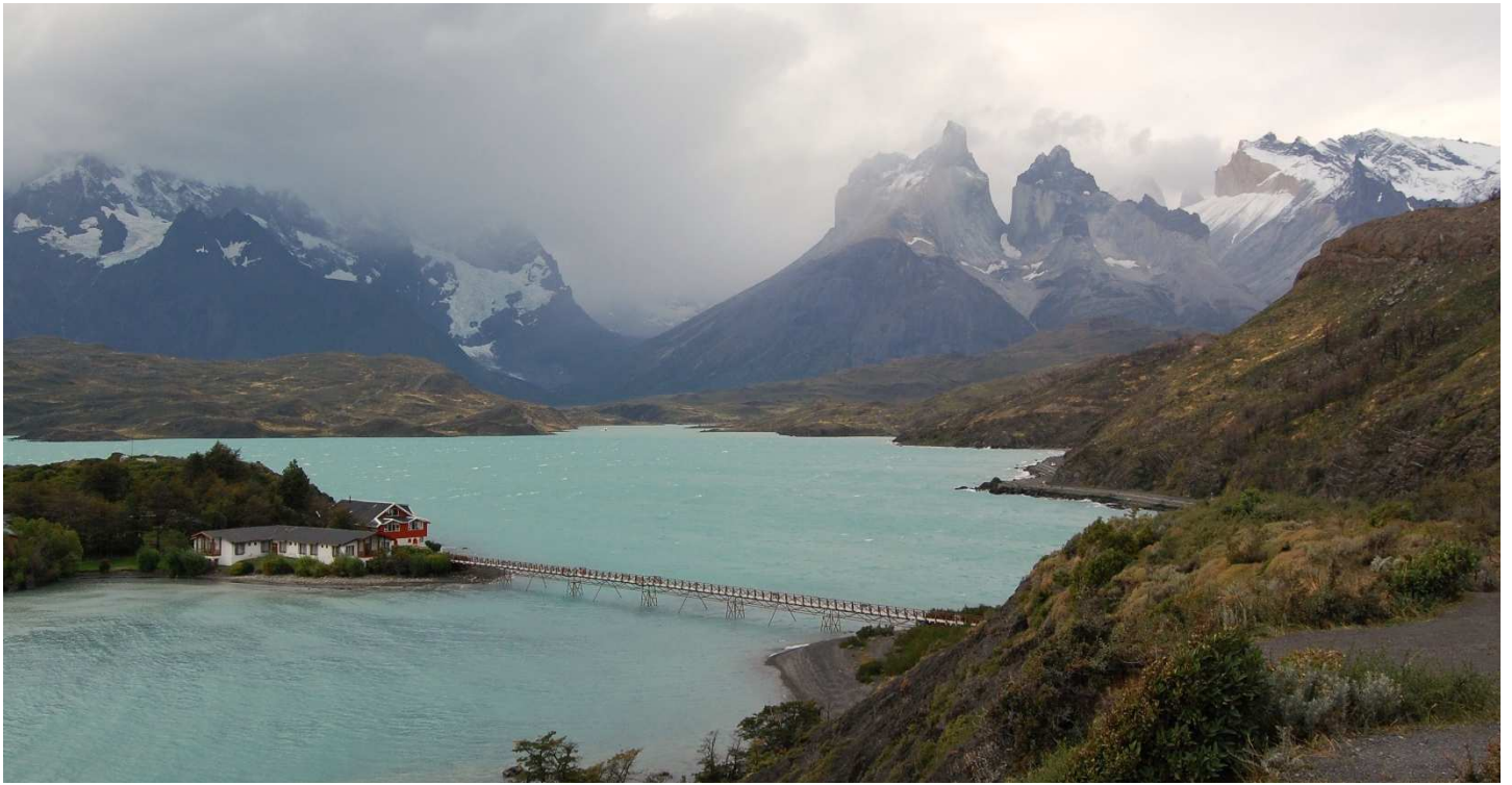
Torres del Paine-Nationalpark